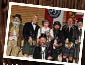
Bart & KulturClub "Belle Moustache" erfolgreich bei der letzten Weltmeisterschaft war Ausrichter der Rekord-WM 2013

Bereits zum 13. Mal organisiert der momentan erfolgreichste Bartclub beim diesjährigen Filderkrautfest am 16. Oktober 2016 die Spitzkraut-Classics in Leinfelden. Mit einem Traktor-Spezial will der Club unweit im Schwabengarten erstmals große und kleine Traktoren und viele Lanz Bulldogs in den Fokus stellen und so einen Vorgeschmack auf dieses Traditionsfest bieten. Die Premiere wird am 24. Juli 2016 stattfinden. "Belle Moustache" wird dafür sorgen, dass viele interessante Traktoren im Schwabengarten eintreffen.